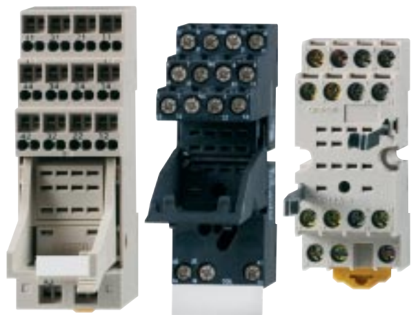
PYF-S Zoccoli con terminali a molla

2 Blocco del pulsante di prova Spostare il pulsante di prova nella seconda posizione (il contatto è bloccato in posizione ON).