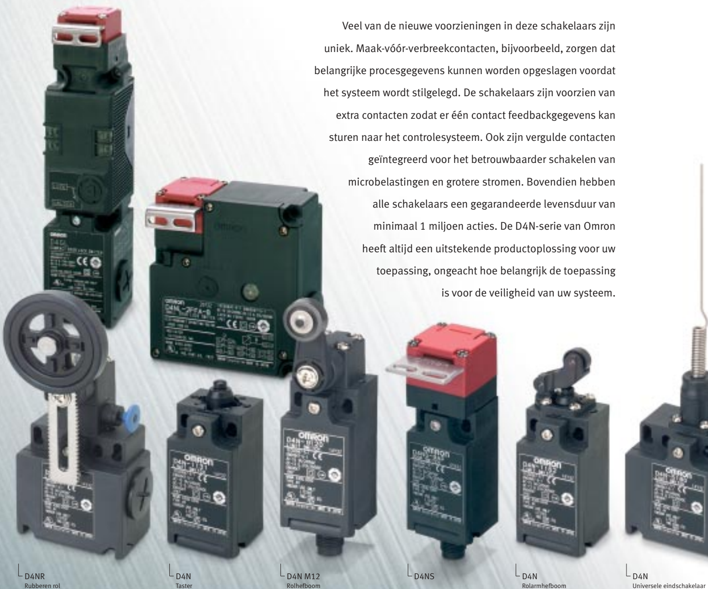
L D4NR Rubberen rol

Veel van de nieuwe voorzieningen in deze schakelaars zijn uniek. Maak-vóór-verbreekcontacten, bijvoorbeeld, zorgen dat belangrijke procesgegevens kunnen worden opgeslagen voordat het systeem wordt stilgelegd. De schakelaars zijn voorzien van extra contacten zodat er één contact feedbackgegevens kan sturen naar het controlesysteem. Ook zijn vergulde contacten geïntegreerd voor het betrouwbaarder schakelen van microbelastingen en grotere stromen. Bovendien hebben alle schakelaars een gegarandeerde levensduur van minimaal 1 miljoen acties. De D4N-serie van Omron heeft altijd een uitstekende productoplossing voor uw toepassing, ongeacht hoe belangrijk de toepassing is voor de veiligheid van uw systeem.