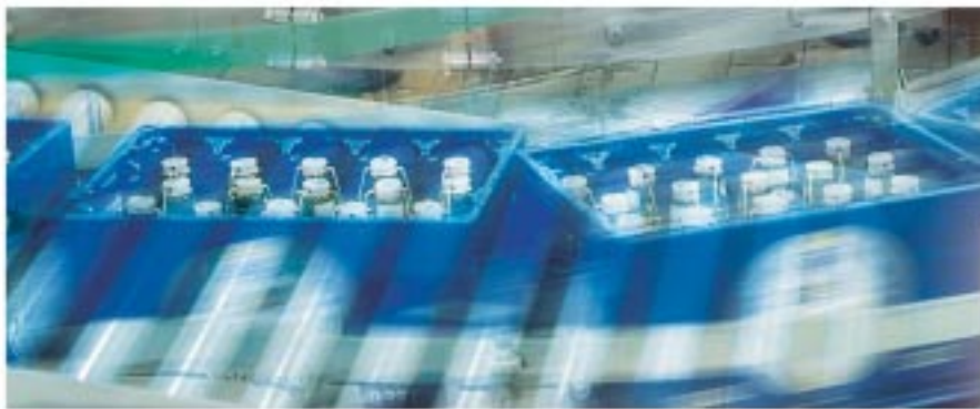
Advanced Industrial Automation

Reduza o tempo de programação e teste, aumentando, ao mesmo tempo, a flexibilidade da máquina.