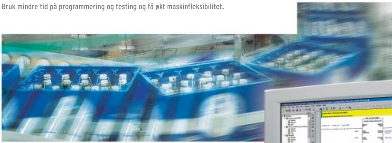
Advanced Industrial Automation

Bruk mindre tid på programmering og testing og få økt maskinflexibilitet.