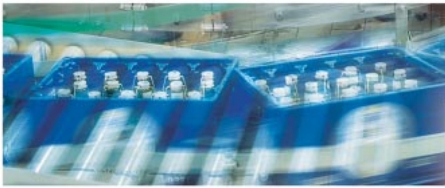
Advanced Industrial Automation

Reduzieren Sie den Zeitaufwand für Programmieren und Testen bei gleichzeitiger Steigerung der Flexibilität Ihrer Maschinen.