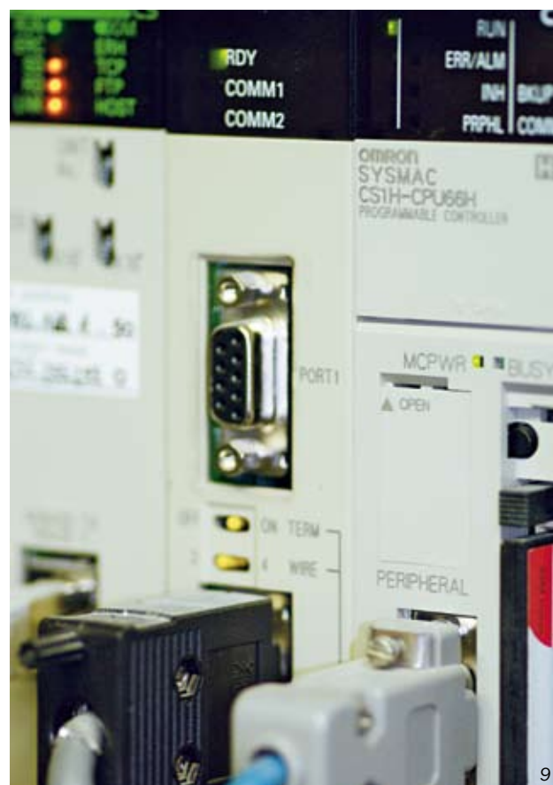
9 - Cuore dell'impianto Niagara di Poggio Renatico è un PLC Omron CS1 con Cpu 66H che gestisce circa 2500 I/O e 200 parametri di misurazione in continuo

il sistema di controllo permette di attivare solo in caso di necessità il movimento della griglia per consentirne lo svuotamento e il ripristino delle condizioni ottimali di funzionamento.