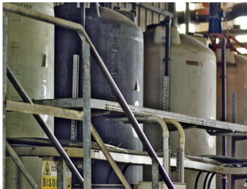
4 - “Niagara ha optato per una gestione totalmente computerizzata con accesso dall’esterno: ogni rifiuto per entrare riceve prima un’omologazione per la valutazione degli inquinanti attesi. Da Pc è possibile consultare un database con i dati commerciali, quelli analitici di laboratorio, la parte di gestione e la logistica.”