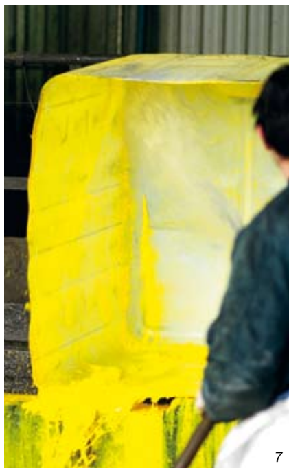
7 - Nello stabilimento Niagara di Poggio Renatico arrivano ogni giorno circa 250 m 3 di reflui (con punte fino a 400 m 3 ) con elevate concentrazioni di emulsioni, metalli solubili (nicel, rame, mercurio e piombo), cromo esavalente, cianuri, fenoli, tensioattivi e aldeidi

Se il PLC rappresenta il cuore dell'intelligenza centralizzata dell'impianto, gli inverter costituiscono la