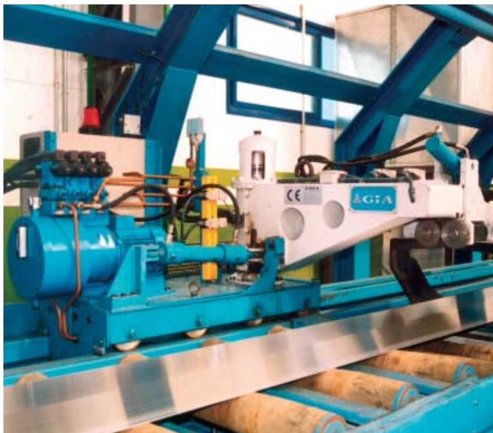
Un système de double crochet

Un système de double crochet (un crochet inférieur et un crochet supérieur) saisit le profilé et le maintient fermement de manière à ce qu'une cisaille à métal puisse couper le morceau d'aluminium déformé. Le crochet dirige également le profilé pour l'empêcher de quitter la ligne de production. Le double crochet ne pousse pas, ni ne transporte les profilés; ils sont éjectés de la presse. Cela nécessite donc une synchronisation des différents systèmes